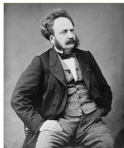
Figura 3. Auguste Cahours (1813-1891).

seus compostos, «dotats de les més íntimes analogies químiques», de manera que fins i tot es podien reemplaçar els uns pels altres sense canviar la forma cristal·lina. Era la propietat que Eilhard Mitscherlich havia anomenat isomorfisme i que també per a Mendeléiev era la clau principal per a entendre les propietats periòdiques. Cahours reconeixia que «si volguérem classificar els metalls mitjançant isomorfisme, no podríem aconseguir-ho», per això va fer servir les classificacions artificials inspirades en l'obra de Thenard (Cahours, 1855-1856).